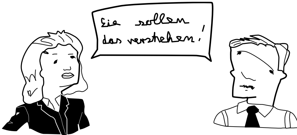
(Abbildung: Moll 2020)

In diesem Abschnitt wird zu Beiträgen aufgerufen, die ihr Hauptaugenmerk auf die – häufig notwendige – didaktische Reduktion innerhalb von hochschulischen Lehr-/Lernsettings legen. Wie gelingt der Wissenstransfer, wenn es um Lern- und Bildungsprozesse geht, beispielsweise auch dann, wenn (messbare) Prüfungsleistungen gefordert sind? Und wie wird die didaktische Reduktion und ggf. die Simplifizierung von Inhalten durch die Lehrenden begründet?